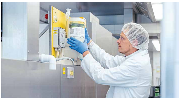
Der Pulverreiniger wird leitwertgesteuert in den Reinigertank der Spülmaschine dosiert.